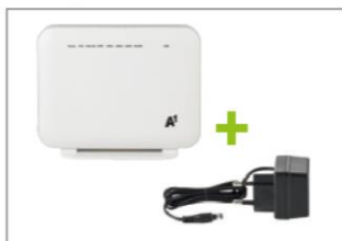
A1 WLAN Box (Modem) inklusive Stromkabel