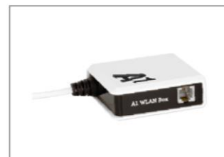
Splitter Nur wenn Sie auch A1 Festnetz-Telefonie bestellt haben