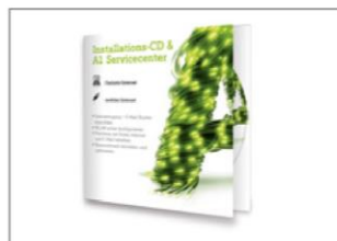
Installations-CD mit A1 Servicecenter