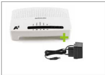
A1 WLAN Box (Modem) inklusive Stromkabel