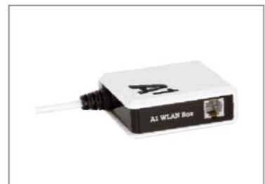
Splitter (nur bei Bestellung von A1 Festnetz- Telefonie)