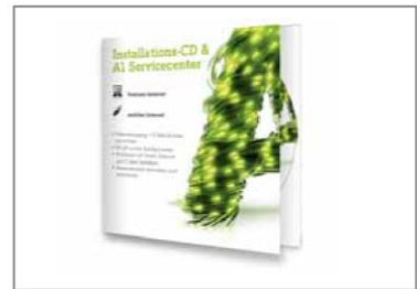
Installations-CD mit A1 Servicecenter